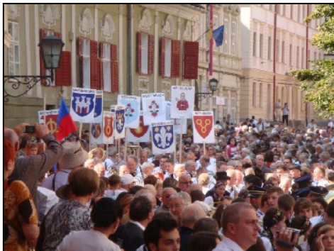
Honterus-Hof mit Burzenland-Wappen