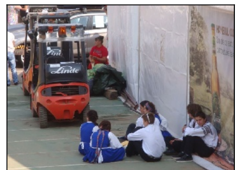
Pause beim Festzelt :-)